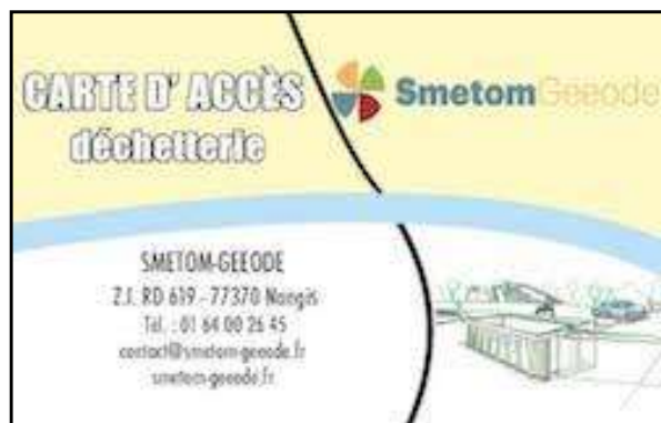
Une carte_dédiée aux services

Pour les professionnels la carte est gratuite sous conditions. Les apports sont payants, selon la nature des déchets déposés. Les tarifs sont fixés par délibération.